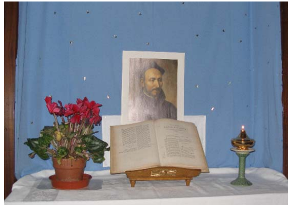
Lámpara en la capilla de la comunidad de la Curia General

Lenguas maternas. Se ha puesto en el tablón de anuncios del zaguán del Aula de la Congregación una estadística con las lenguas maternas de los congregados. 47 de los congregados tienen al español como lengua materna, y le siguen el Inglés (43) Malayo (13) Tamil (12), Francés (11), Portugués (11), Konkani (10), Polaco (7), Italiano (6), Alemán (6), Dutch (5), Catalán (4), Hindi (4). Dos congregados tienen por lengua materna el Vietnamita, Javanés, Húngaro, Euskera, Malagasy, Croata, Slovako y Árabe. El listado lo completa una treintena de lenguas maternas con un solo congregado.