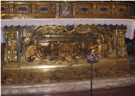
Lámpara junto a la urna con los restos de San Ignacio, en el Gesù

La lámpara votiva sigue luciendo en el Gesú, junto a los restos de San Ignacio. A imitación de este gesto del P. General, una lámpara permanece encendida junto a una imagen de San Ignacio en la capilla de la comunidad de la curia General, así como en muchas casas de la Compañía.