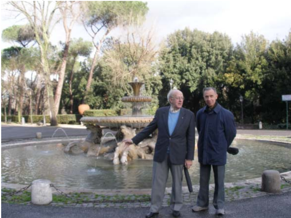
Visita a la Villa Borghese y su galería