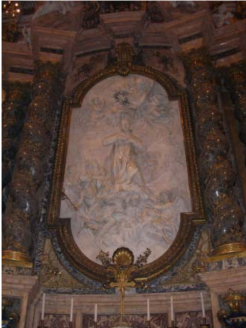
Altar de San Luis Gonzaga en la iglesia San Ignacio, Roma

Durante la mañana del día 22, se presentó en el aula el segundo borrador del decreto sobre “Gobierno.” Por la tarde comenzó la segunda ronda de asuntos para el gobierno ordinario, en concreto se discutieron las propuestas sobre Vida Comunidad, Formación y Fomento de Vocaciones.