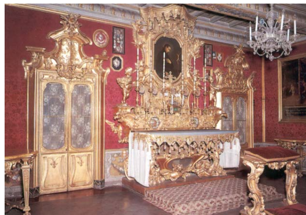
Habitación de San Luis Gonzaga antes de la última restauración