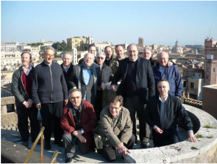
Foto de parte de la Asistencia de Europa Meridional en su visita al observatorio de San Ignazio

gos) noble de los herederos de la familia que edificó la iglesia San Ignazio. En la