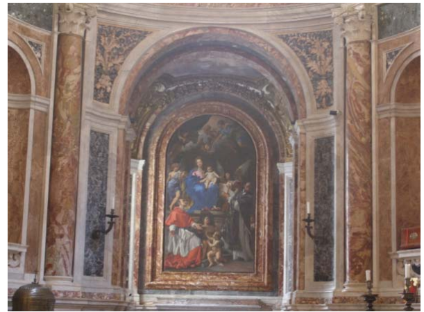
Iglesia Santa María in Vallicella