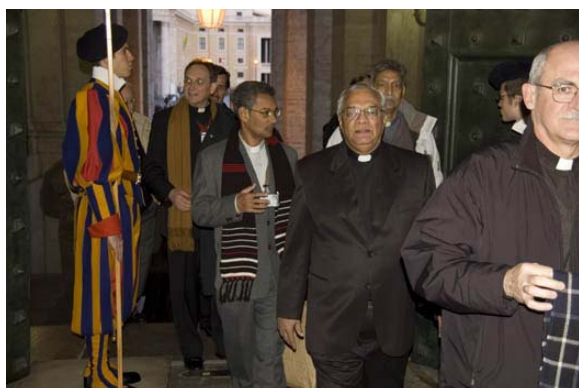
Visita a la Capilla Sixtina, 9 de febrero.