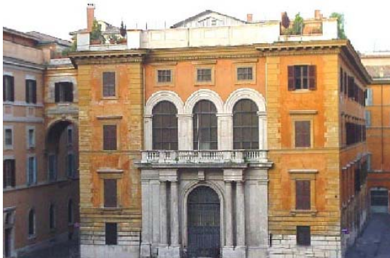
Biblioteca del Instituto Bíblico

El día 4 de febrero continúa la presentación y discusión sobre la vida comunitaria y el trabajo de las casas romanas de la Compañía: Universidad Gregoriana,