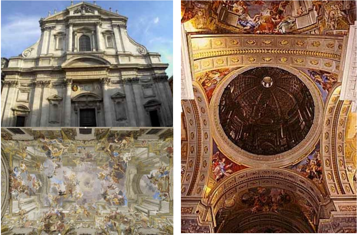
Iglesia de San Ignacio