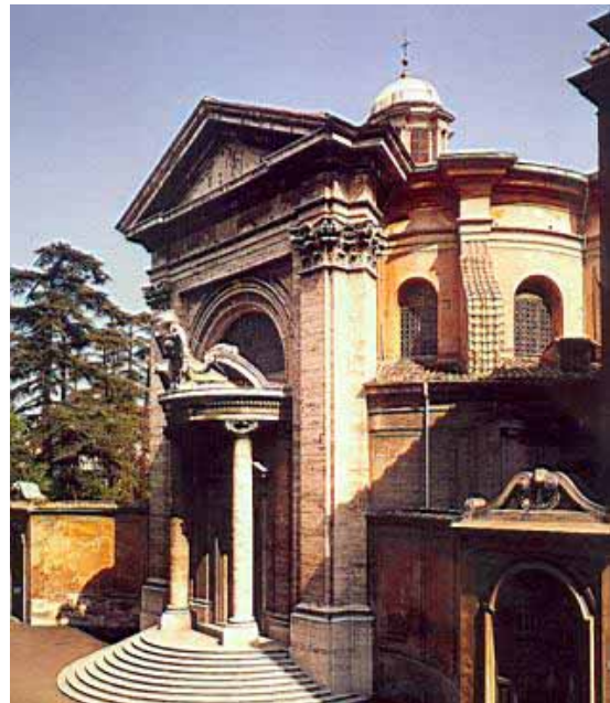
Iglesia Sant'Andrea al Quirinale