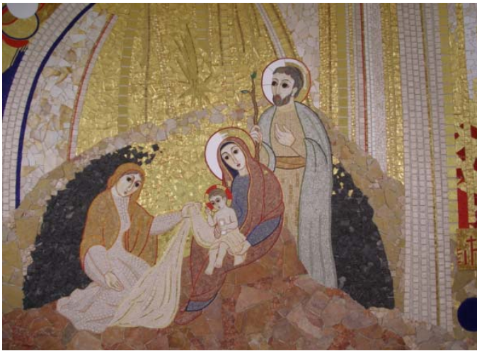
Mosaico de Rupnik en la capilla de la Enfermería de la DIR

Los días 1 y 2 de febrero se han dedicado a tratar temas de gobierno ordinario en el Aula, con el objetivo de ofrecer orientaciones al P. General. El tratar temas de gobierno ordinario en la Congregación es una novedad, por lo que no hay procedimientos experimentados.